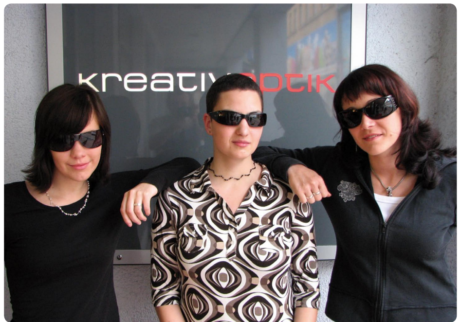
Statt bunten Gläsern wie in den vergangenen Jahren, sind jetzt wieder dunkel getönte Gläser wieder im Trend.