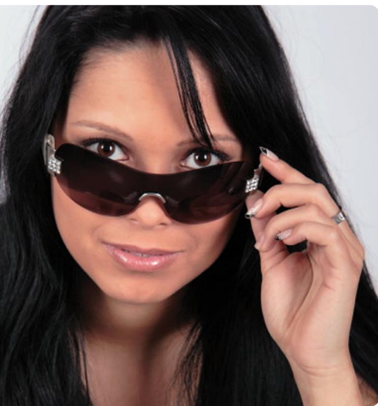
Eine gute Sonnenbrille sollte modisch sein und die Augen schützen.

Form der Gläser.“ Die Modebranche hat nicht einfach die Modelle von damals 1:1 übernommen. „Neu sind die gekrümmten, sportlichen Formen. Die Bügel sind oft mit dem Label der Hersteller verziert“, so Zöbisch. Der Trend geht weg von bunten Gläsern, hin zu den getönten Gläsern in Braun, Grau, Graugrün oder auch Verlaufsfarben. „Auf manchen Brillen findet sich auch ein leichter Silberschimmer, ein modischer Effekt, der die Augen des Trägers immer noch erkennen lässt“, nennt der Optikermeister eine weitere modische